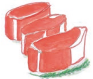
Solomillo de vaca