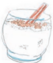
Arroz con leche