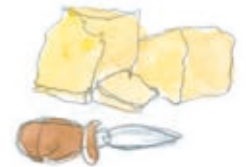
Tabla de queso Stilton 14,5€