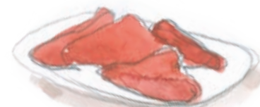
Pimientos del piquillo reellenos de ternera y setas con salsa de piquillo